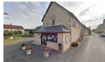
Salle des fêtes de La Marche